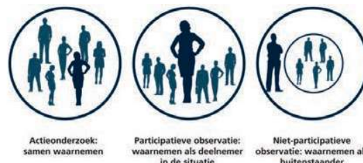
Figuur 5 Actieonderzoek, participierend onderzoek en traditioneel (beschouwend) onderzoek (Van der Zouwen, 2018)

Een goede manier om het afstuderen beter te laten aansluiten op de behoeften van het werkveld is gebruikmaken van actieonderzoek. Actieonderzoek combineert onderzoek en actie; daarbij komen alle betrokkenen samen tot inzichten. Bij actieonderzoek doet de student onderzoek in de praktijk met zo veel mogelijk mensen uit die praktijk. Zo maakt hij al lerende het verschil (zie Figuur 5).