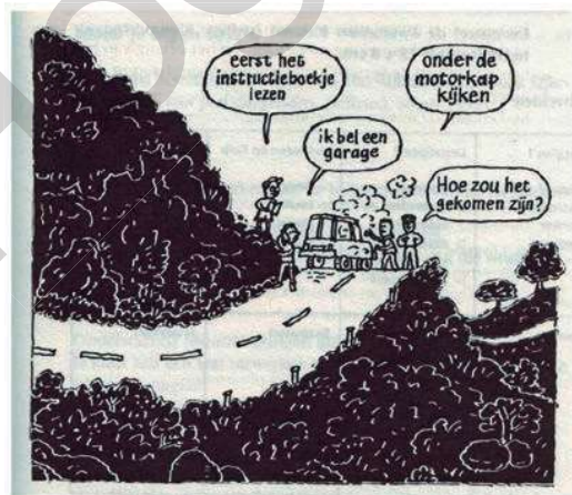
Figuur 6 Iedereen leert (en doceert) volgens zijn eigen voorkeurstijl (Hendriksen, 2005)

Bekende psychologen die leerstijlen hebben beschreven, zijn Kolb (2017) en Vermunt (Bridge2learn, 2017). Plas (2008) stelt: 'Gemotiveerd leren gaat over de relatie tussen leerstijlen, begeleidingsstijlen en leermotivatie.'